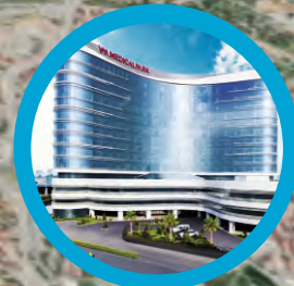
VIA MEDICALPARK HASTANESİ