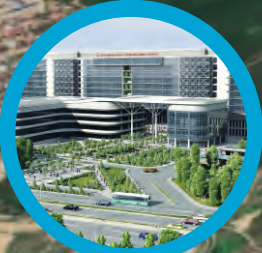
KARTAL EĞİTİM ARAŞTIRMA HASTANESİ