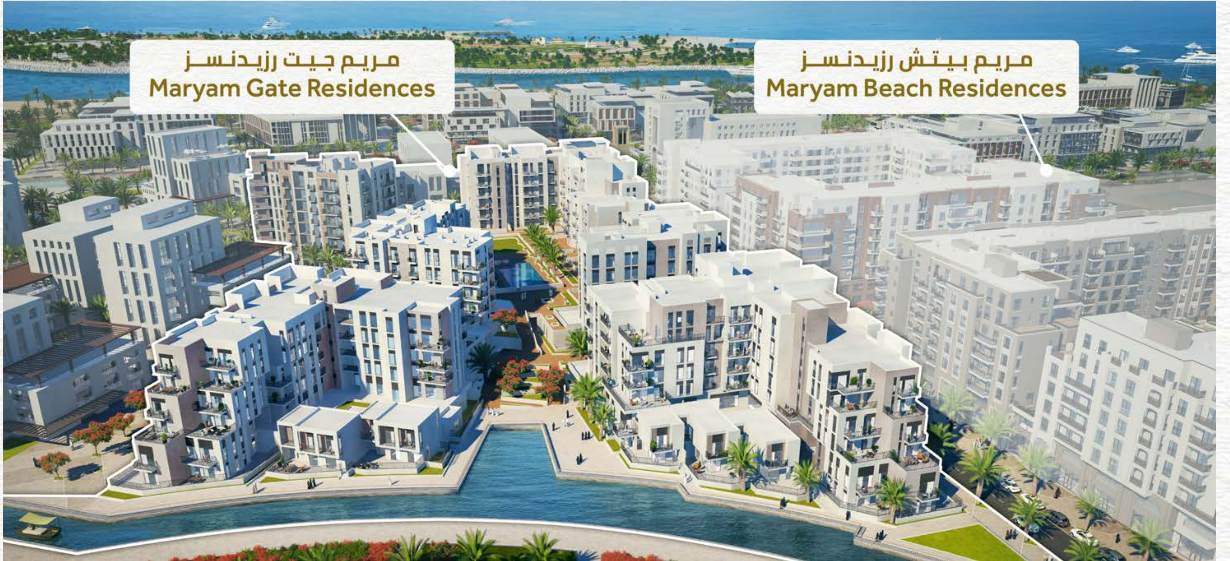
مریم بیتش رزیدنسز Maryam Beach Residences