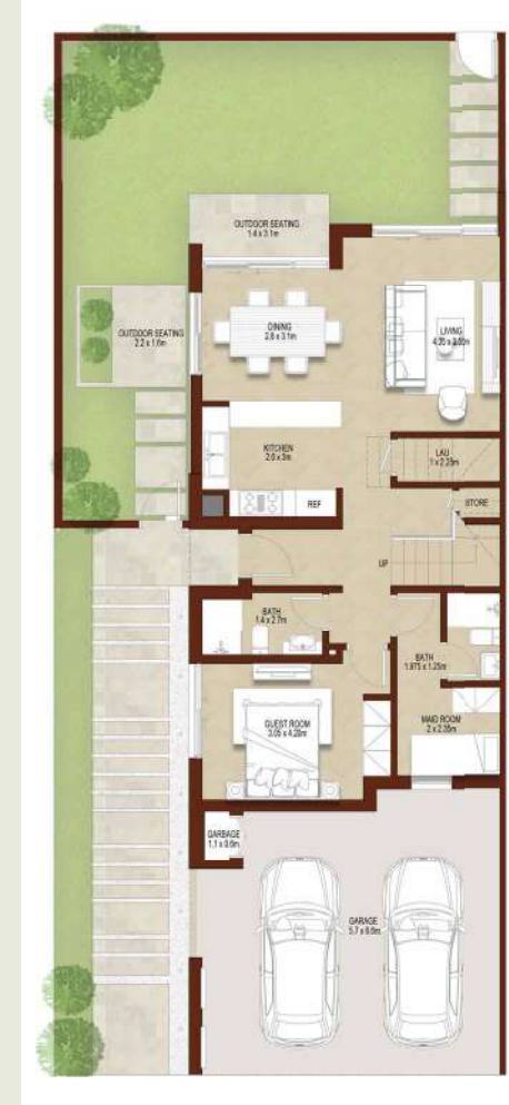
GROUND LEVEL الطابق الأرضي