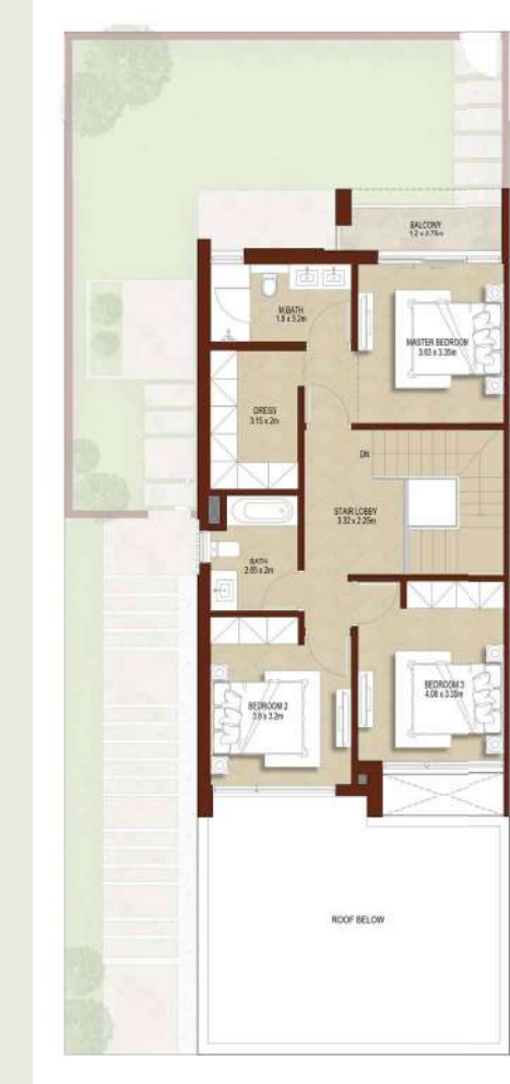
FIRST LEVEL الطابق الأول