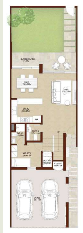
GROUND LEVEL الطابق الأرضي