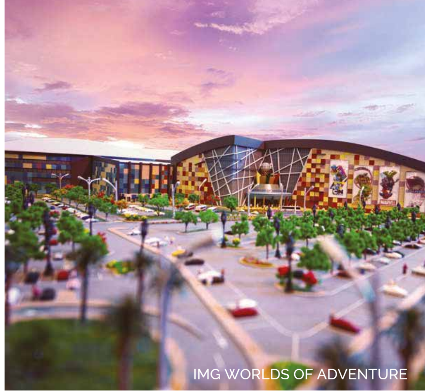
IMG WORLDS OF ADVENTURE