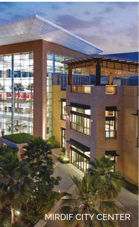
MIRDIF CITY CENTER