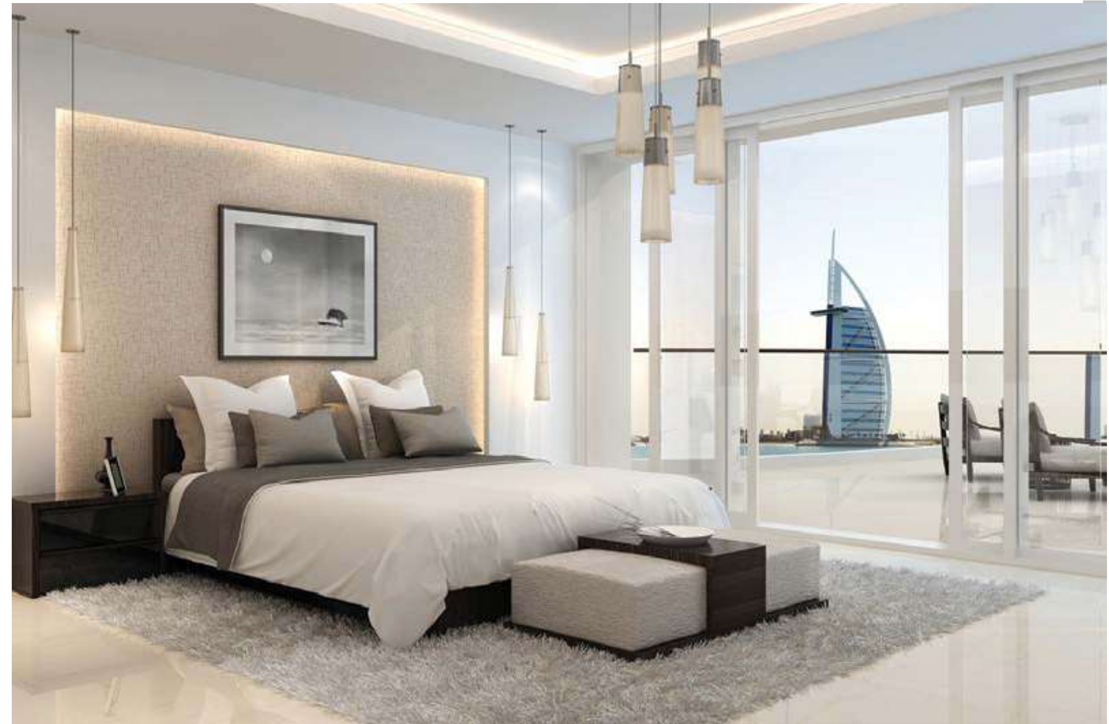
Spacious and well-designed bedrooms with floor-to-ceiling windows and large terrace provide sea view and privacy. All bedrooms are en suite.

التصميم الداخلي الأنيق لغرف المعيشة، مع أرضيات رخام، وخطوط واضحة، والأوان محايدة وتنشيطات دقيقة.