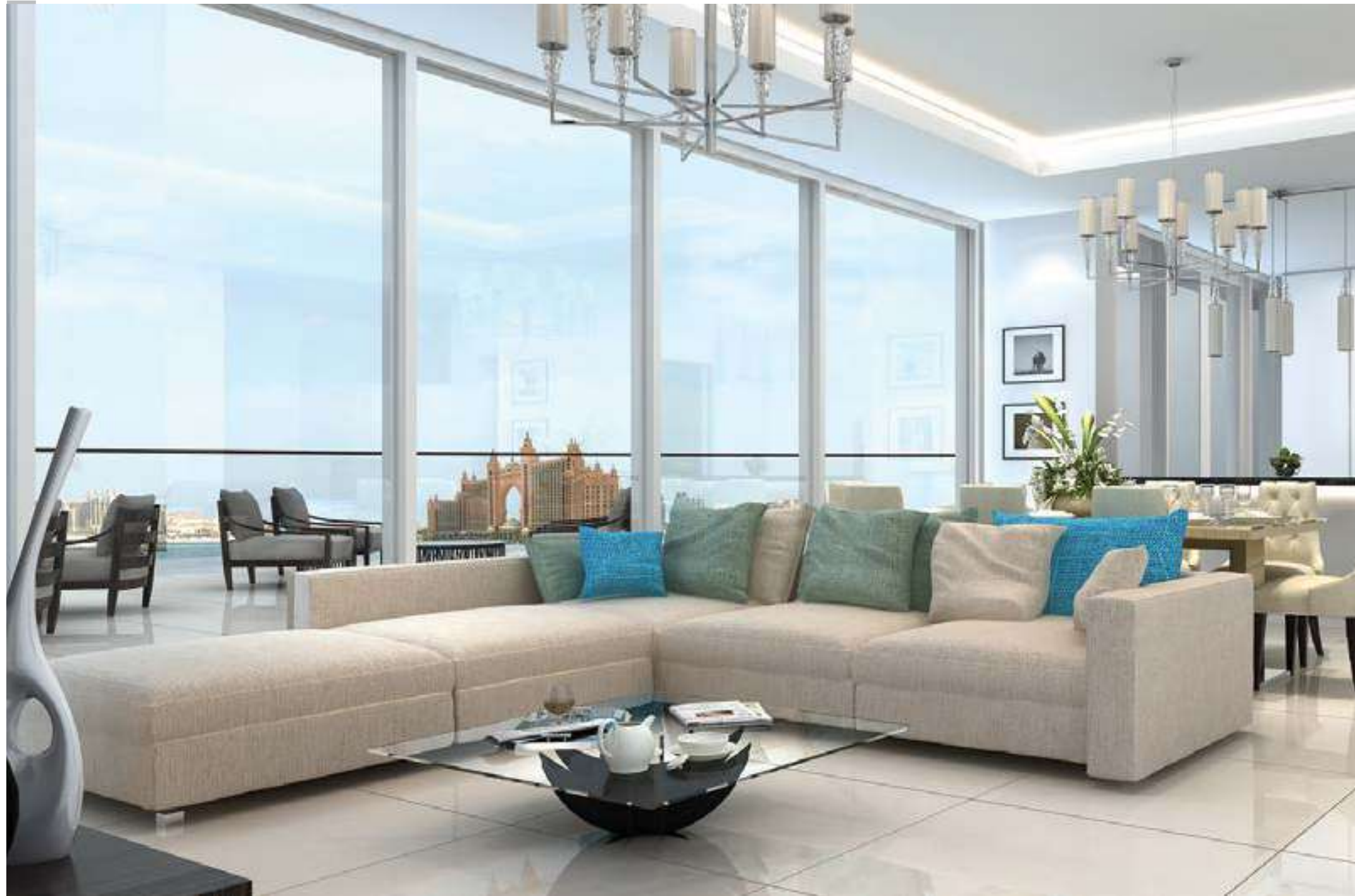
Sleek living room interiors with clean lines, neutral tones and meticulous finishes.

التصميم الداخلي الأنيق لغرف المعيشة، مع أرضيات رخام، وخطوط واضحة، والأوان محايدة وتنشيطات دقيقة.