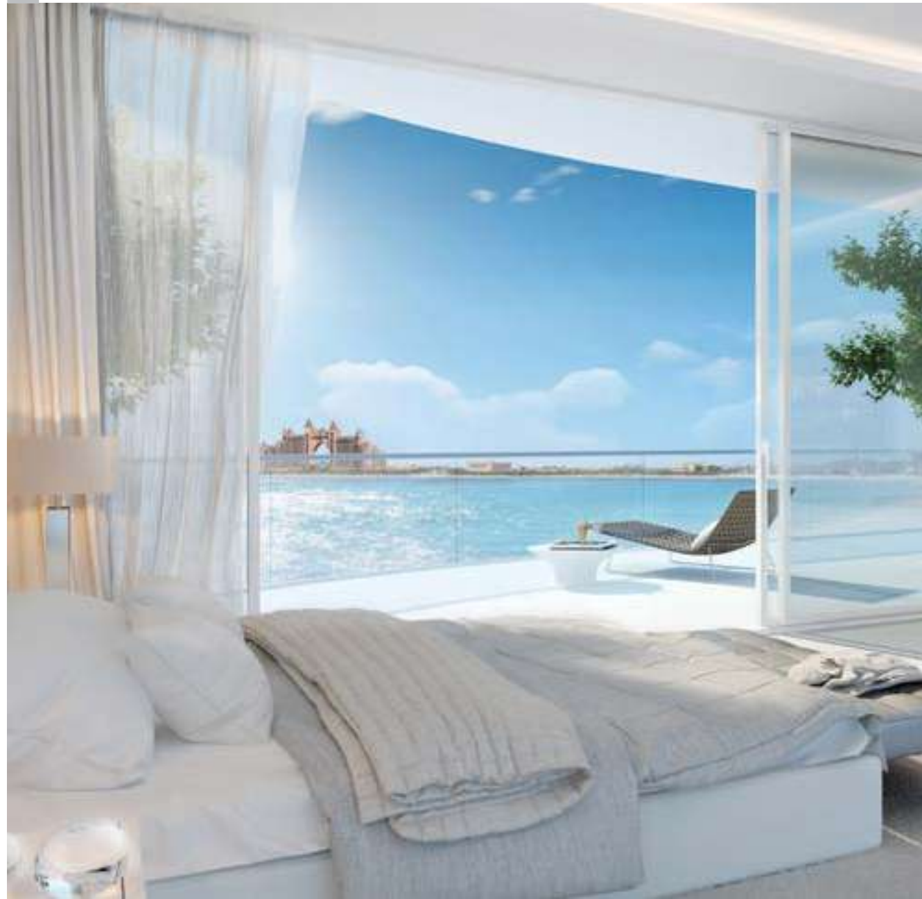
Large private terraces perfectly orientated with views of the Atlantis Hotel and Dubai skyline.

شرفات خاصة واسعة، مواجهة لإطلالات أتلانتيس ومناظر مدينة دبي الساحرة.